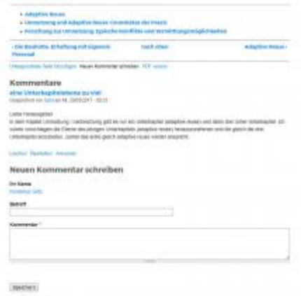
Kommentar abgeben