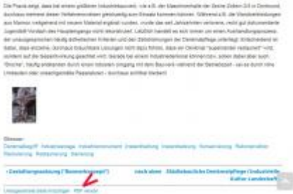
PDF erzeugen