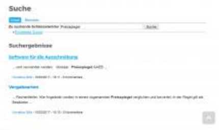
Suchen Bildurheberrechte: Screenshot Indumap