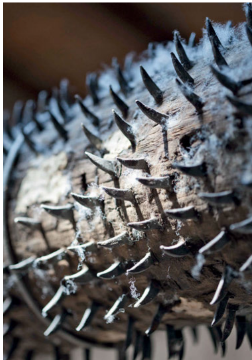
Bild 3: Diese hölzernen Walzen des Krepelwolves, die die Wolle auseinander reißen, mussten für den Vorführbetrieb erneuert werden, weil die Reißzähne in dem Holz keinen sicheren Stand mehr hatten. Diese Walze hängt über dem Wolf zur Ansicht und verdeutlicht den Austauschprozess für die Museumsgäste.

Mindestens ebenso wichtig wie der Bildungseffekt ist die Möglichkeit, durch den Vorführbetrieb das Wissen über den