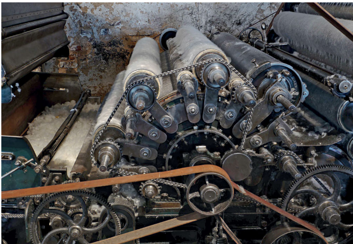
Bild 2: Auf dem Krempelsatz von 1913 wird wieder Wolle kardiert, um Vorgarn herzustellen. An dieser Maschine müssen immer mal wieder klassische Verschleißteile wie Antriebsriemen, Kratzenbelege und Nitschelhosen erneuert werden. Allerdings sind das Elemente, die auch schon im historischen Betrieb regelmäßig gewechselt wurden, wahrscheinlich sogar sehr viel häufiger als im reduzierten Museumsbetrieb.